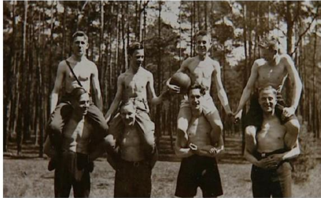
Image d'archive extraite du documentaire « Paragraphe 175 » de Rob Epstein et Jeffrey Friedman.

Rob Epstein et Jeffrey Friedman avaient réalisé en 1995 un instructif documentaire sur la représentation de l'homosexualité à Hollywood, The Hollywood Closet . Cinq ans plus tard, ils accentuent le registre et font œuvre de pionniers en évoquant le sort des homosexuels durant le règne de la barbarie nazie. Le film avait été montré au festival du film de Berlin en 2001, où il obtint l'Ours d'or dans la catégorie, avant de sortir, notamment en France. A peu près invisible depuis lors, le voici de nouveau accessible, démontrant encore sa grande qualité et rappelant, dans un contexte d'extrême droitisation des Etats et des consciences, à quoi mènent inexorablement les politiques du pire.